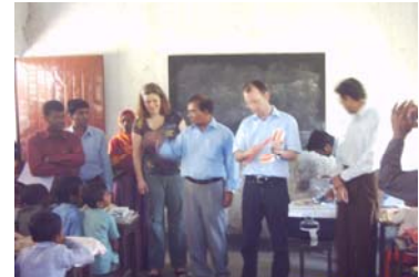
Zahnhygienische Demonstration in der BESCO-Schule