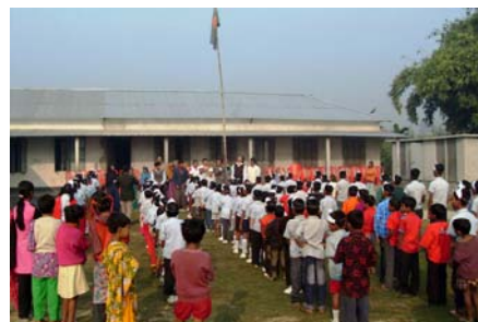
SchülerInnen bei der Feier des Nationalen Unabhängigkeitstages im Dez. 2009

Die Grundschule ist nun fast fertig. Die restlichen Bauarbeiten (z. B. die Errichtung eines Zauns für das Schulgelände sowie eines Schotterwegs von der Dorfhauptstraße zur Schule) werden im Laufe dieses Jahres fertig gestellt.