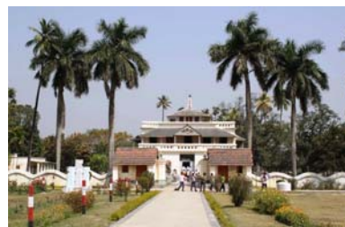
Haus des Literaturnobelpreisträgers „Tagore“ in Kushtia