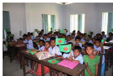
Klassenzimmer der Grundschule