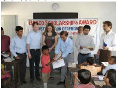
Übergabe der finanziellen Mittel an eine Schülerin der BESCO-Grundschule