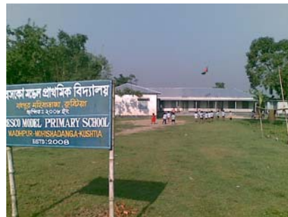
BESCO- Grundschule, Feb. 2010 (Zahl der SchülerInnen=182)

Die Bauarbeiten für die endgültige Fertigstellung der Schule gehen zügig voran. Zwei weitere Klassenzimmer und die Toilettenanlage wurden inzwischen fertig gestellt. Seit Februar 2010 besuchen 182 SchülerInnen die „BESCO-Model Primary School“.