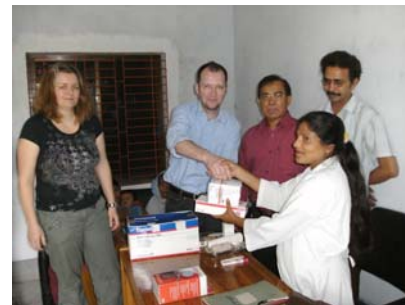
Übergabe von Verbandsmaterial an die Krankenschwester

ben, sowie ein gespendetes Blutdruckmessgerät übergeben. All das verbessert das Umfeld und die Betreuung der Patienten erheblich.