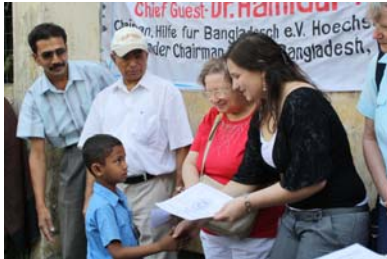
Übergabe der finanziellen Mittel an einen Schüler einer Grundschule

Diese Förderung ermöglicht den Kindern den Kauf von Schulmaterial und dient als Anreiz für gute Noten, die die Voraussetzung für beruflichen Erfolg darstellen.