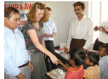
Zahnpasta und -bürsten für die SchülerInnen