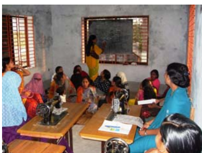
Ausbilderin und die Kursteilnehmerinnen

Dieses Projekt wurde bereits im Februar 2006 mit der Unterstützung von acht Schüler/innen einer Grundschule und einer weiterführenden Schule in Kushtia gestartet. Die Kinder, die von uns direkte finanzielle Unterstützung erhalten, haben die besten Noten in ihrer Klasse, stammen aus den ärmsten Familien und werden von der Schulleitung empfohlen. 2007 erhielten 12 Schüler/innen aus drei Schulen solche Hilfe. Im Jahr 2008 konnten wir insgesamt 26 Schüler/innen aus drei Schulen (eine Grundschule und zwei weiterführende Schulen) berücksichtigen, darunter auch Schülerinnen einer weiterführenden Mädchenschule. 2009 haben 28 SchülerInnen aus drei Schulen in einer feierlichen Zeremonie von der sechsköpfigen Delegation aus Deutschland eine finanzielle Förderung erhalten. 2010 konnten wir insgesamt 36 SchülerInnen aus vier Schulen, darunter auch die BESCO-Schule berücksichtigen.