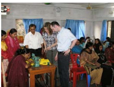
Näherin bei der Arbeit

2009 erlaubten uns großzügige Spenden das Trainings-Center mit dem Erwerb von einem Zuschneidetisch, Nadeln, Scheren sowie weiteren Nähmaschinen, darunter zwei Embroider-