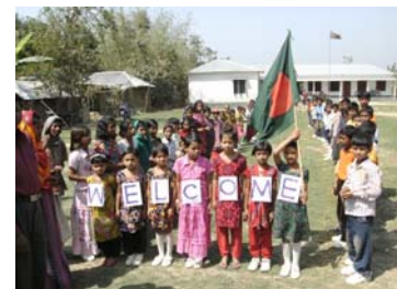
Empfang für die Gäste