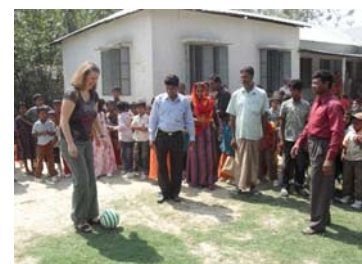
Fußball mal anders