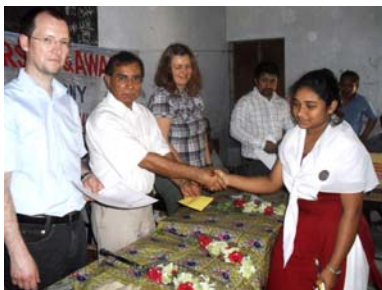
Übergabe der finanziellen Mittel an eine Schülerin einer weiterführenden Schule