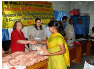
Übergabe der Zertifikate für die Teilnehmerinnen des Nähkurses

Nähmaschinen für aufwendige Stickereien, auszubauen. Im März 2009 konnten wir in einer feierlichen Zeremonie 42 Frauen ihr Zertifikat über die erfolgreiche Teilnahme am Nähkurs.