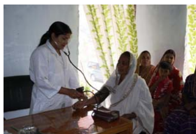
Die Krankenschwester bei ihrer Arbeit

Das im Jahr 2007 mit einer Halbtagskrankenschwester gestartete Projekt konnte jetzt ein wenig ausgebaut werden.