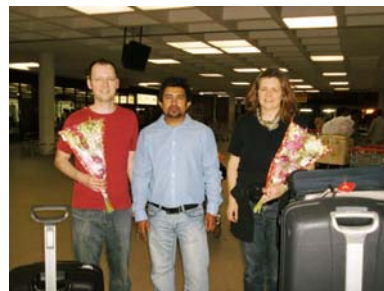
Die Delegation am Flughafen Dhaka, empfangen von einem Mitarbeiter von BESCO-Bangladesh