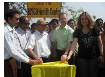
Am Bauplatz der Krankenstation